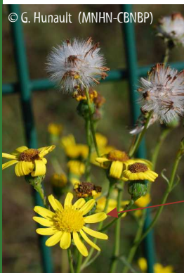
Fleurs et fruits

Akènes longs de 2 à 2,5 mm, cylindriques, pubescents entre les côtes Aigrette blanche, 2 à 3 fois plus longue que les akènes